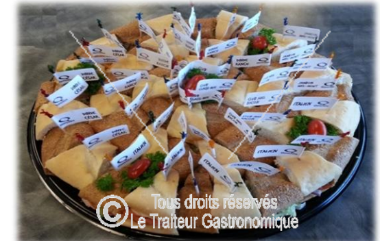
© Tous droits réservés Le Traiteur Gastronomique

Anniversaire Baptême Funérailles Mariage